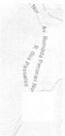
Captura da imagem: mar. 2023